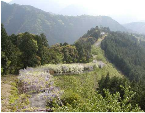
美しい藤棚で癒されます。